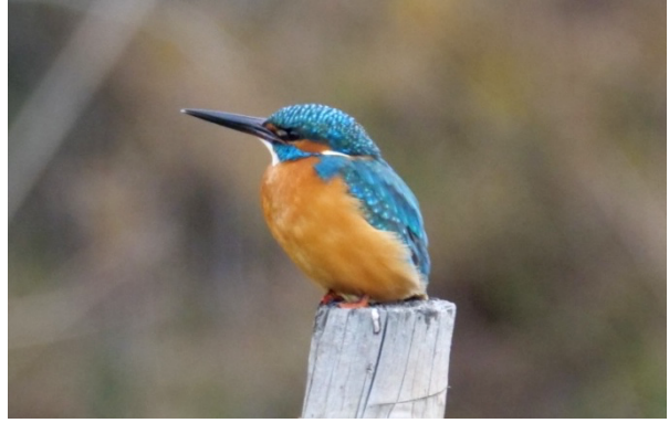
Martin-pêcheur d'Europe (hivernant)