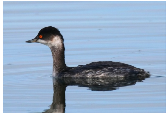
Grèbe à cou noir (hivernant)