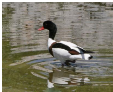
Tadorne de Belon