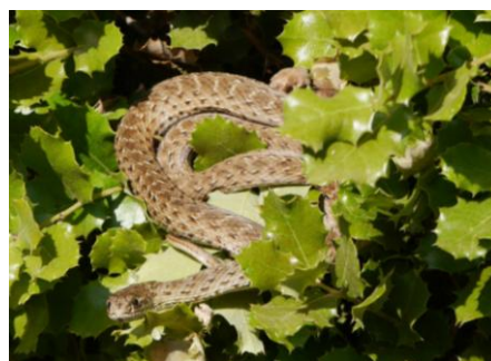
Couleuvre de Montpellier